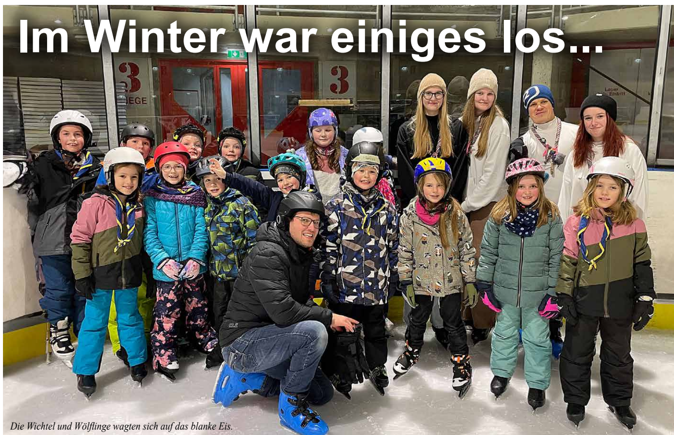
Die Wichtel und Wölflinge wagten sich auf das blanke Eis.