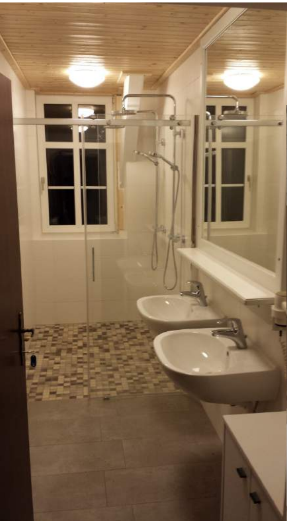
Sanitärbereich im OG (Duschen / Waschgelegenheit)