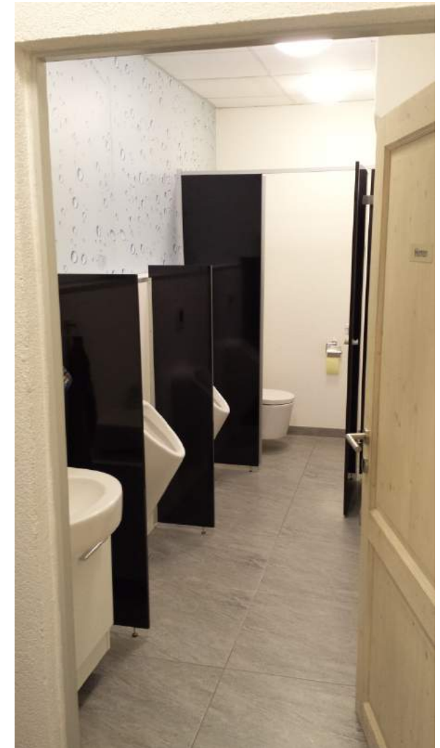
Sanitäranlagen im EG