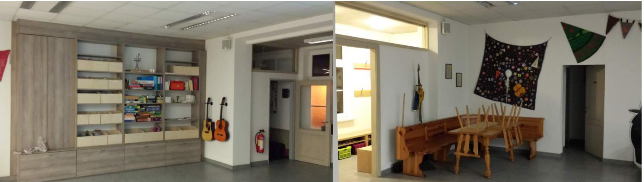
Großer Raum im EG 2 Sitzecken, Leinwand, Beamer, Musikanlage