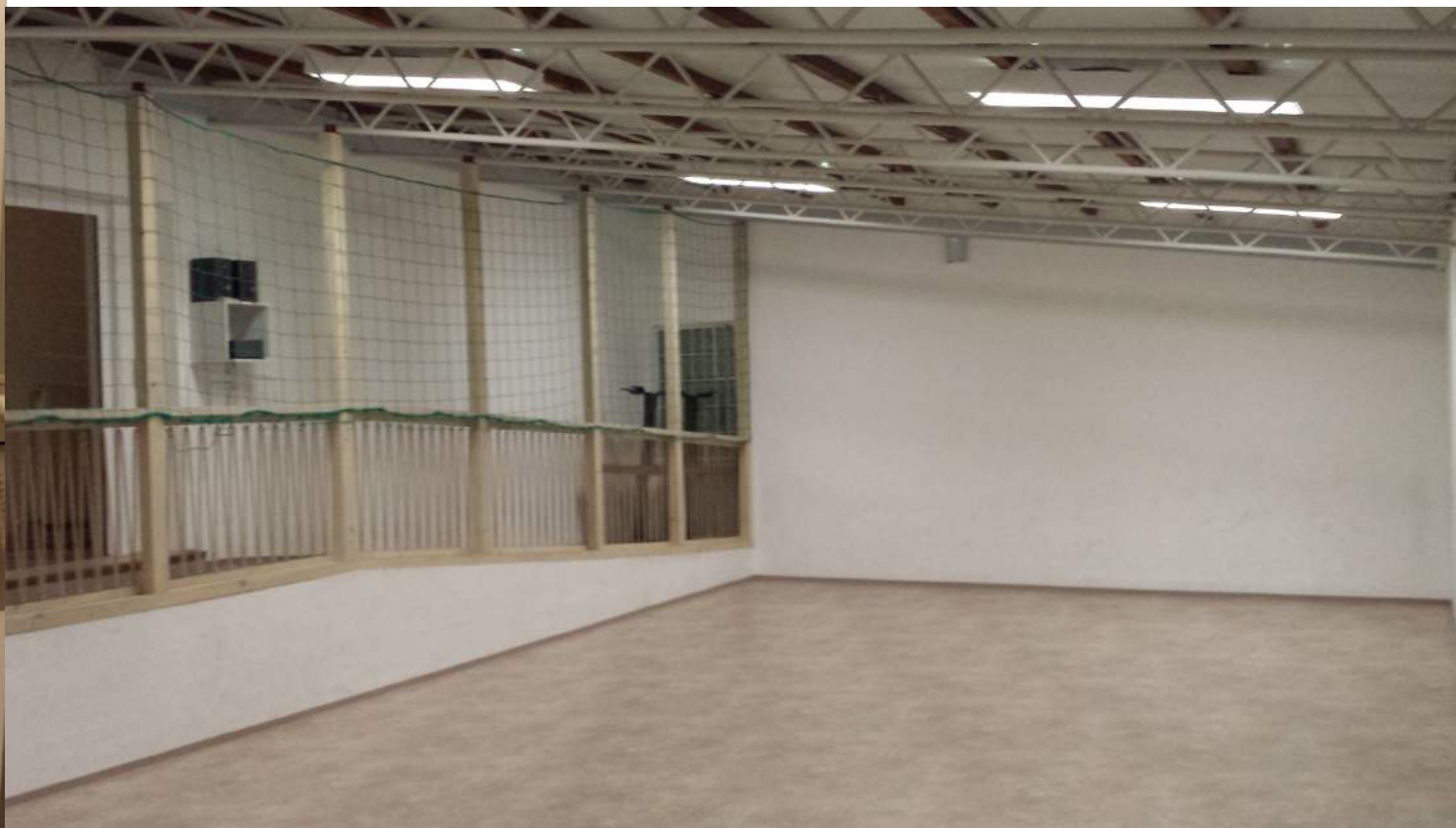
Spieleraum – Platz zum Austoben (Spielgeräte vorhanden) bzw. als Schlafsaal nutzbar