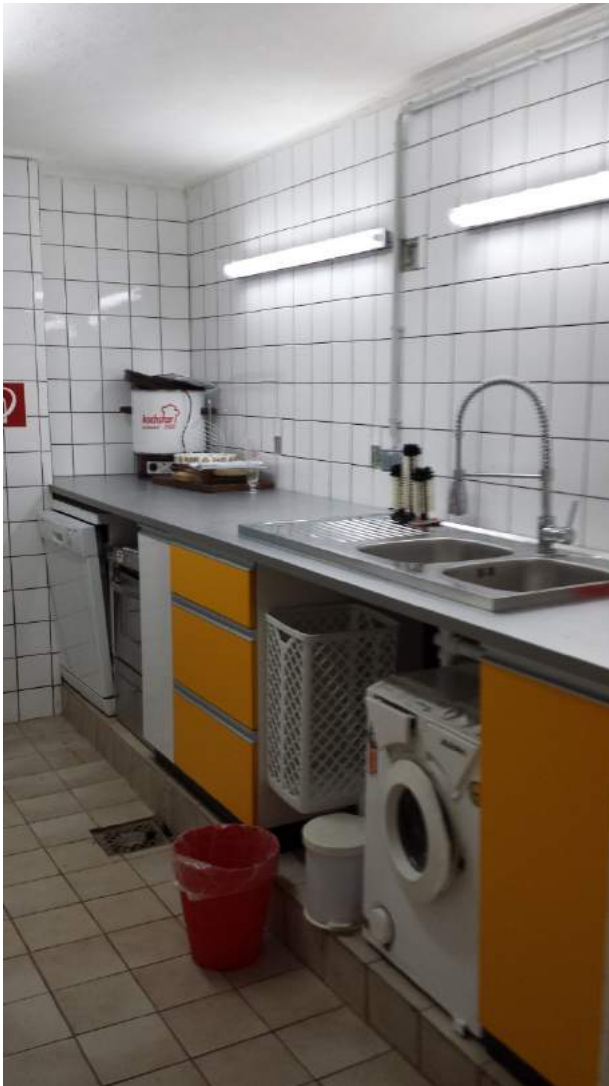
Waschküche mit Geschirrspüler, Gläserpüler, Waschmaschine