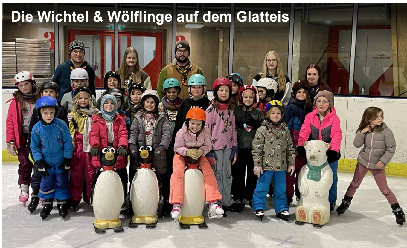
Die Wichtel & Wölflinge auf dem Glatteis

Für die Nummer 136 unserer Gruppenzeitung haben wir 280 Exemplare hergestellt.