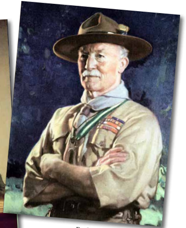
Robert Baden-Powell, Lord of Gilwell