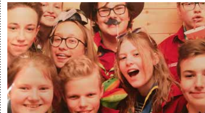
Ca/Ex: Keiner ist schöner.

(PS.: Es wird keine Gewähr für den Wahrheitsgehalt dieses Artikels übernommen.)