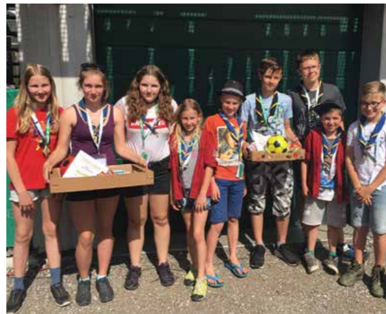
Die zwei erfolgreichen Patroullen Biber und Elefanten

Obwohl wir sehr stolz auf uns waren, freuten wir uns mehr auf unser Bett zuhause und die Heimfahrt im Bus verlief bis auf ein paar Schlafgeräusche sehr ruhig.