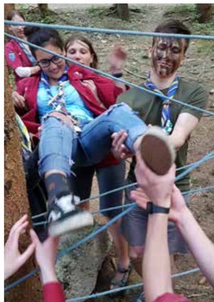
Ra/Ro: Gemeinsam Hindernisse überwinden

Die Ra/Ro wurden am Samstag in der Hollensteiner Wildnis ausgesetzt und mussten zwei Tage überleben. Um einen Unterschlupf für die Nacht bauen zu können, sollten die Überlebenskämpfer Aufgaben erledigen und bekamen als Belohnung Planen und Seile. Am Sonntag fingen sie mit bloßen Händen Fische und brieten diese über offenem Feuer.